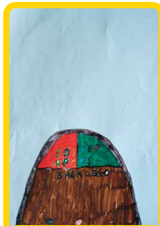
Ο LEGO Batman θα σε πάει στη βάση των σούπερ ηρώων.