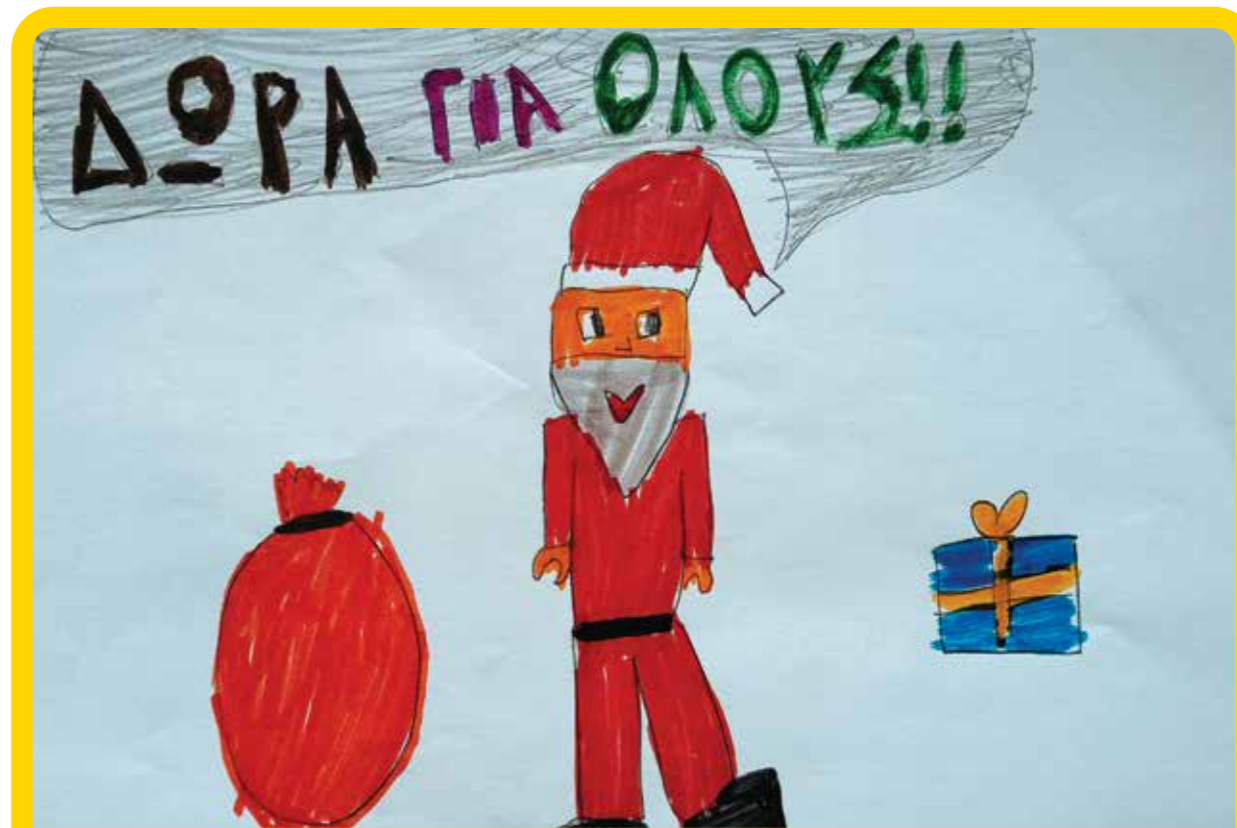
Θα σε περιμένει ο Άγιος Βασίλης φτιαγμένος από χιλιάδες LEGO με δώρα για όλους.