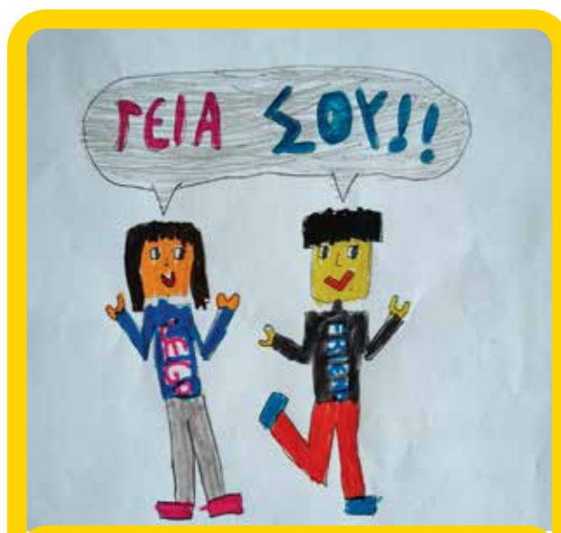
Θα σε υποδεχτούν πολύχρωμα LEGO.