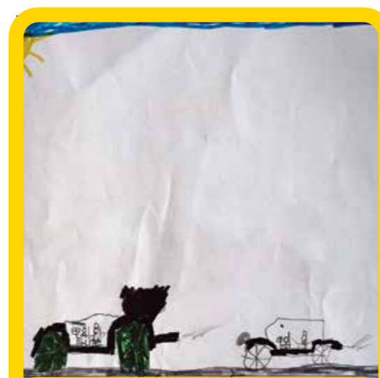
Μετά θα ανοίξεις σαν LEGO CAN.