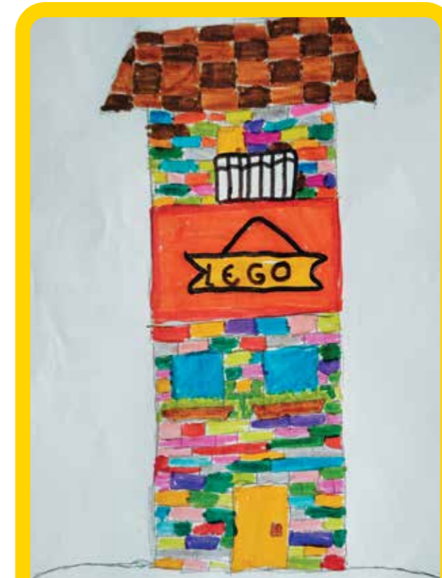
Εκεί θα μπεις στα LEGO Friends.