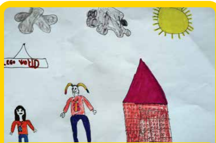
Αν έρθεις στο ΚΠΙΣΝ θα ανοίξεις μια πόρτα και θα βρεθείς σε έναν κόσμο LEGO.