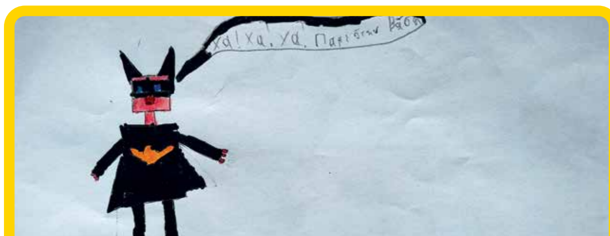
Θα βρεις τον LEGO Batman.